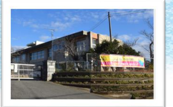
150年の歴史を祝う市西小学校

次期公共資産マネジメント推進計画作成にあたり、「子どもの最善の利益」という権利を守り、そして地域文化を守るという経済合理性の面からも、学校統廃合施策の再考を求めました。